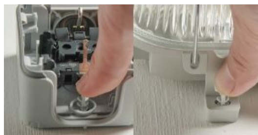
Mit dem DSN 50 gelingen auch Montagen von Brandmeldern, Leuchten und Steckdosen auf Daumendruck.