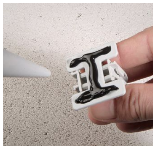
Der EC Euro-Clip kann mit Hilfe der EKP Euro-Klebeplatte auch auf Gipskarton montiert werden.