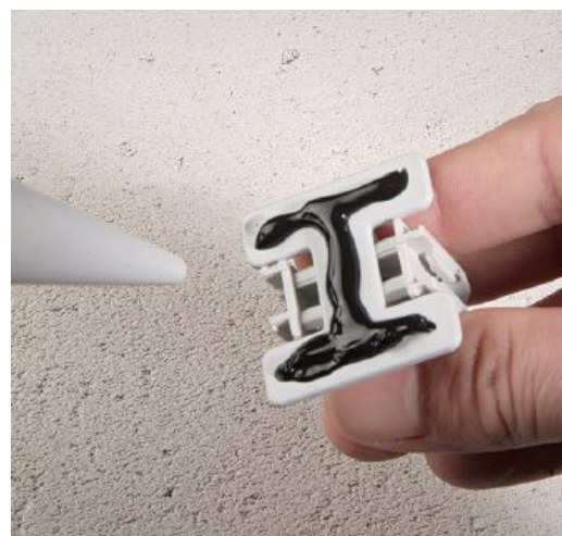
Der EC Euro-Clip kann mit Hilfe der EKP Euro-Klebeplatte auch auf Gipskarton montiert werden.