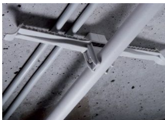
Mit Hilfe eines EC Euro-Clips lässt sich auch ein Rohr am KBS mittig befestigen.

Schnabl Stecktechnik GmbH Bahnhofplatz 1, Postfach 63, 3100 St. Pölten, Austria Telefon +43(0)2742/22167-0, Telefax +43(0)2742/22167-50 office@schnabl.works, www.schnabl.works