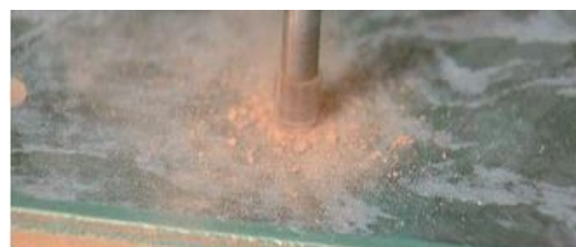
Der LB Lanzenbohrer ist ideal auch für Fliesen und Keramik.