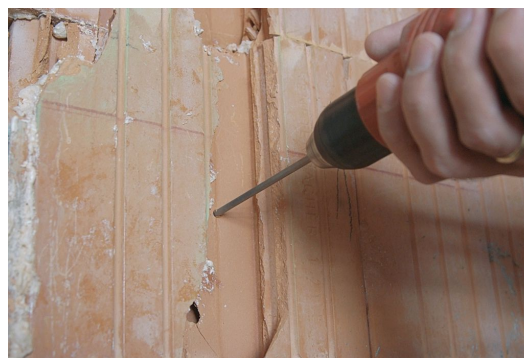
Selbst Profis sehen hier den LB Lanzenbohrer zum ersten Mal und geben ihn dann nie wieder her.

Schnabl Stecktechnik GmbH Bahnhofplatz 1, Postfach 63, 3100 St. Pölten, Austria Telefon +43(0)2742/22167-0, Telefax +43(0)2742/22167-50 office@schnabl.works, www.schnabl.works