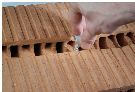
Einfach clever: Die integrierte Nase an der Innenseite der Schelle erlaubt das Spannen des Schlauches zwischen zwei Schellen - für einen leichteren Kabeleinzug.

Schnabl Stecktechnik GmbH Bahnhofplatz 1, Postfach 63, 3100 St. Pölten, Austria Telefon +43(0)2742/22167-0, Telefax +43(0)2742/22167-50 office@schnabl.works, www.schnabl.works